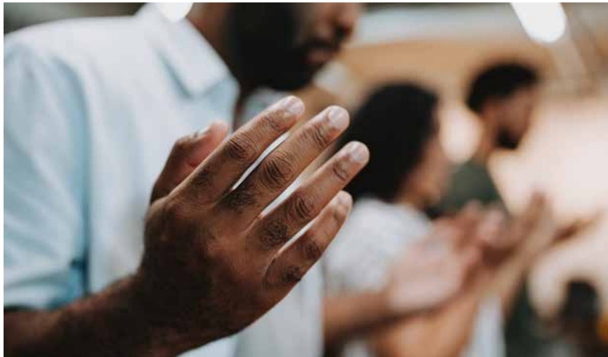
Tijdens de worship wordt ‘the Lord’ geprezen met vele halleluja’s.