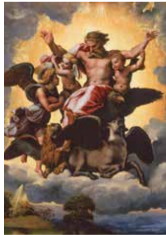
RAFAËL, HET VISIEN VAN EZECHIEL