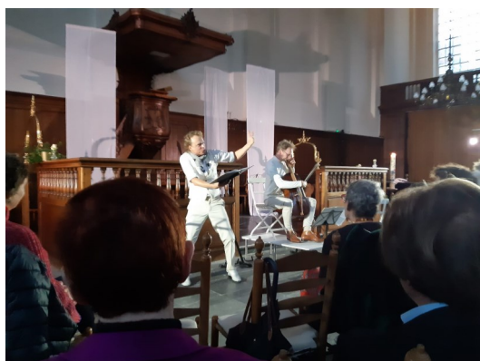
Bach-Luther cellosuites afgelopen 29 oktober in de Lutherse Kerk

Wilt u actuele informatie vanuit onze gemeente lezen?