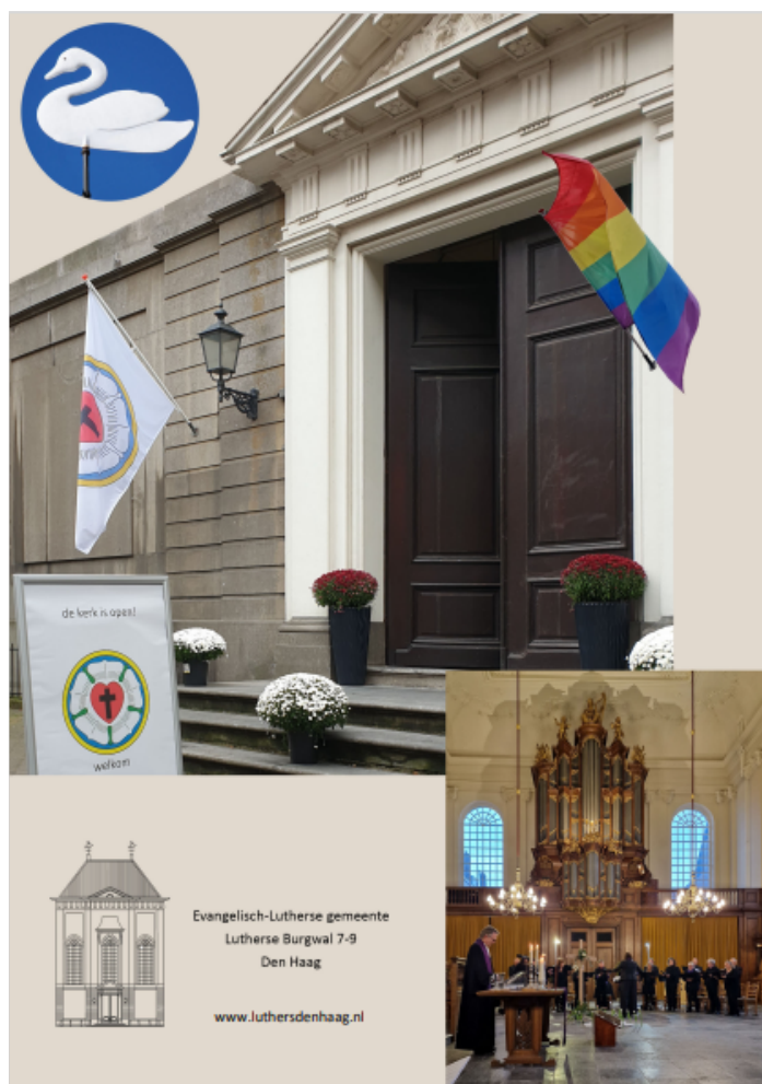
Opmaak: Ineke van der Veen